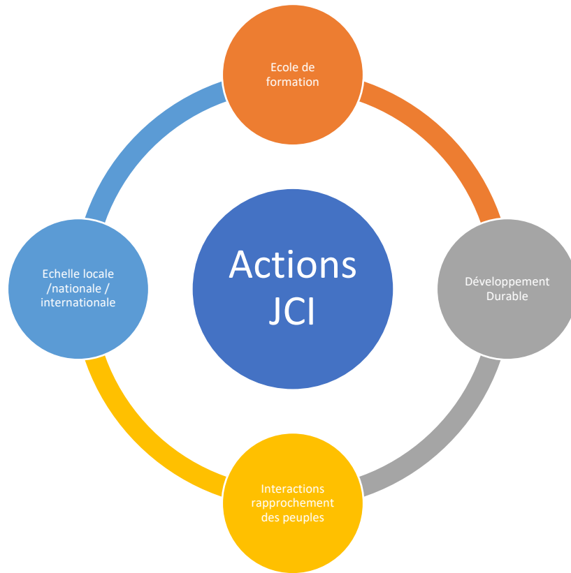
Schéma des actions JCI